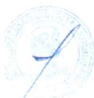
CUADRO N° 01

Luego, de una evaluación de la Entrevista Personal de forma virtual de cada uno de los postulantes "APTO", se obtuvo como Resultado Final el siguiente cuadro: